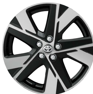
17" kola z lehké slitiny, pneumatiky 175/65 R17 Pro výbavu Style