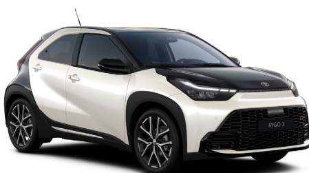
2PU Bílá perleťová se střechou, zadní částí a kapotou v černé barvě metalický lak, dostupný pro verzi GR SPORT 15000 Kč