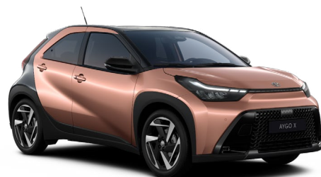
M49 Hnědá měděná se střechou a zadní částí v černé barvě metalický lak, dostupný pro verze Style a Executive 15000 Kč