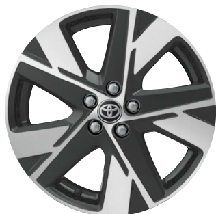
17" kola z lehké slitiny, pneumatiky 175/65 R17 Pro výbavu Comfort