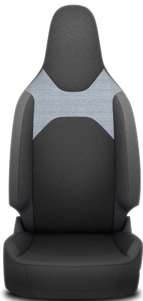
FA20 Látkové čalounění Pro výbavu Active a Comfort