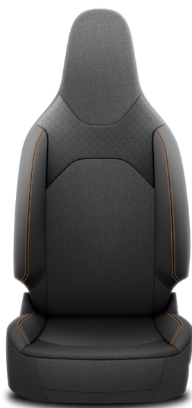
EA40/EA60/EA90/EA91 Látkové čalounění v kombinaci s perforovanou ekokůží SakuraTouch® a prošíváním v barvě karoserie Pro výbavu Executive