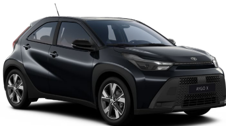
209 Černá noční obloha metalický lak, dostupný pro verze Active a Comfort 10000 Kč