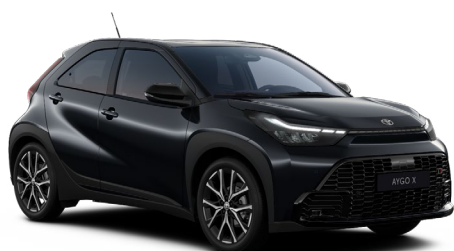
209 Černá noční obloha metalický lak, dostupný pro verzi GR SPORT bez příplatku