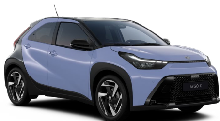
M51 Modrá levandulová se střechou a zadní částí v černé barvě pastelový lak, dostupný pro verze Style a Executive bez příplatku