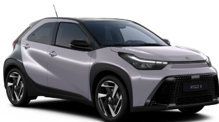
M14 Stříbrná Jasmín se střechou a zadní částí v černé barvě metalický lak, dostupný pro verze Style a Executive 15000 Kč