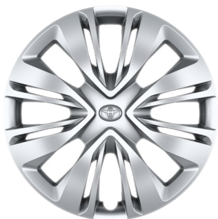
17" ocelová kola s celoplošnými kryty, pneumatiky 175/65 R17 Pro výbavu Active