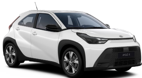
040 Bílá čistá standardní lak, dostupný pro verze Active a Comfort bez příplatku