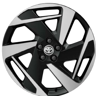
18" kola z lehké slitiny, pneumatiky 175/60 R18 Pro výbavu Executive