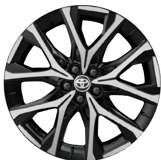
18" kola z lehké slitiny, pneumatiky 175/60 R18 Pro výbavu GR SPORT