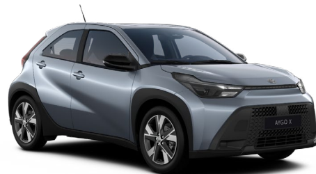
1K3 Modrošedá metalický lak, dostupný pro verze Active a Comfort 10000 Kč