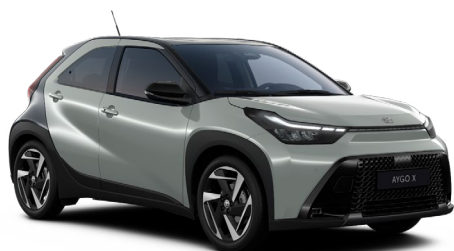
2VN Zelená Urban se střechou a zadní částí v černé barvě pastelový lak, dostupný pro verze Style a Executive 15000 Kč