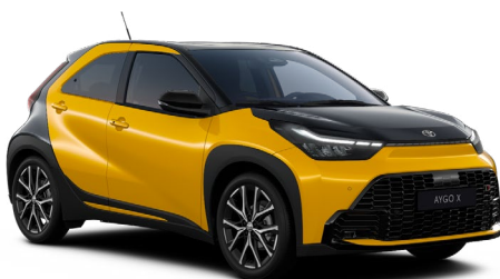
M50 Žlutá hořčicová se střechou, zadní částí a kapotou v černé barvě metalický lak, dostupný pro verzi GR SPORT 15000 Kč