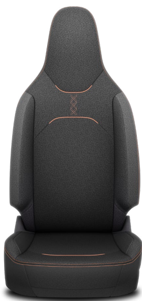
FB40/FB60/FB90/FB91 Látkové čalounění s detaily v barvě karoserie Pro výbavu Style