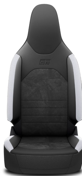
EB20 Látkové čalounění v kombinaci s ekokůží SakuraTouch® a ekosemišsem Dinamica® s logem GR Pro výbavu GR SPORT