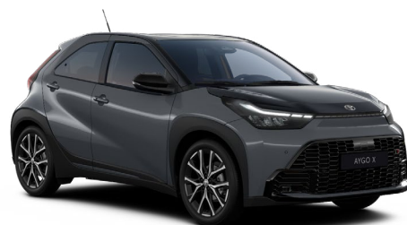
M52 Šedá břidlicová se střechou, zadní částí a kapotou v černé barvě metalický lak, dostupný pro verzi GR SPORT 15000 Kč