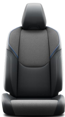
EC20 Černé semišové čalounění s modrým prošíváním (syntetické materiály) Pro výbavu Style