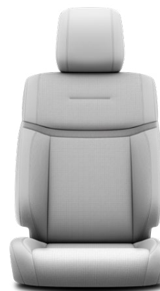
LA10 Kožené čalounění v šedé barvě (přírodní a syntetická kůže) Pro výbavu Executive