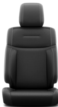
LA20 Kožené čalounění v černé barvě (přírodní a syntetická kůže) Pro výbavu Executive