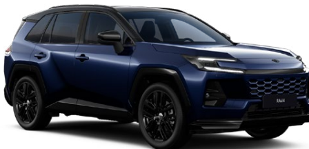
M40 Modrá – tmná se střechou v černé barvě metalický lak, dostupný pro verzi Style 25 000 Kč