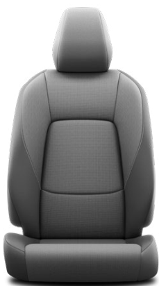
FA20 Černé látkové čalounění Pro výbavu Comfort