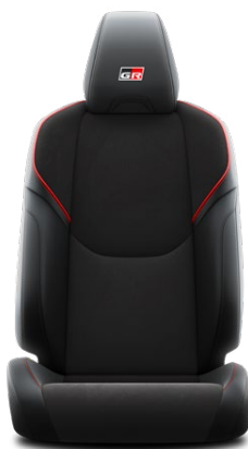
ED20 Semišové a kožené čalounění s červeným prošíváním a logem GR (syntetické materiály) Pro výbavu GR SPORT