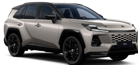
2SQ Bronzová – Avantgarde se střechou v černé barvě metalický lak, dostupný pro verzi Style 25 000 Kč