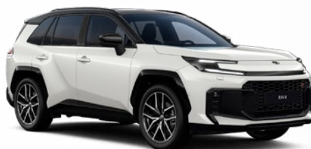
2VP Bílá – perleťová se střechou v černé barvě perleťový lak, dostupný pro verze Style a GR SPORT 25 000 Kč