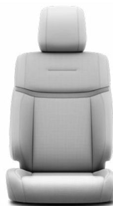
LA10 Kožené čalounění v šedé barvě (přírodní a syntetická kůže) Pro výbavu Executive