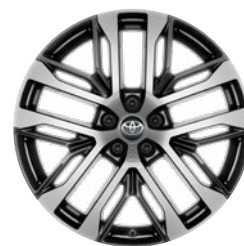
20" kola z lehké slitiny se stříbrným lemováním, pneumatiky 235/50 R20 Pro výbavu Executive