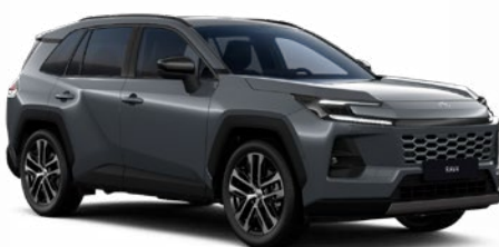
1L6 Modrá – ocelová pastelový lak, dostupný pro verze Comfort a Executive 19 000 Kč