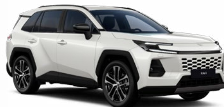
089 Bílá – perleťová perleťový lak, dostupný pro verze Comfort a Executive 25 000 Kč