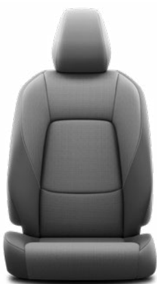
FA20 Černé látkové čalounění Pro výbavu Comfort