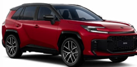
2TB Červená – karmínová se střechou v černé barvě metalický lak, dostupný pro verzi GR SPORT 25 000 Kč