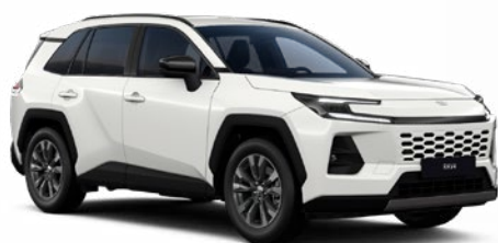
040 Bílá – čistá standardní lak, dostupný pro verze Comfort a Executive 19 000 Kč