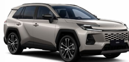
4V8 Bronzová – Avantgarde metalický lak, dostupný pro verze Comfort a Executive 19 000 Kč