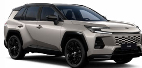
2SQ Bronzová – Avantgarde se střechou v černé barvě metalický lak, dostupný pro verzi Style 25 000 Kč