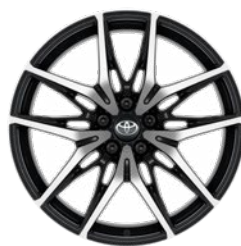
20" kola z lehké slitiny GR SPORT, pneumatiky 235/50 R20 Pro výbavu GR SPORT