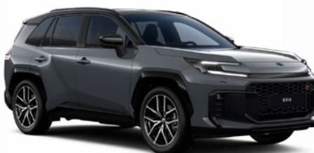
M22 Modrá – ocelová se střechou v černé barvě metalický lak, dostupný pro verze Style a GR SPORT 25 000 Kč