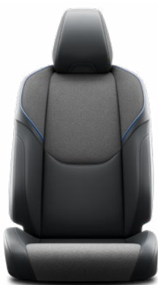
EC20 Černé semišové čalounění s modrým prošíváním (syntetické materiály) Pro výbavu Style