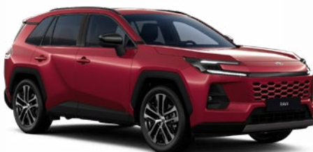
3T3 Červená – rubínová speciální lak, dostupný pro verze Comfort a Executive 25 000 Kč