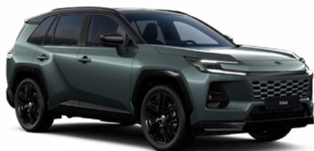
M39 Zelená – opálová se střechou v černé barvě metalický lak, dostupný pro verzi Style 25 000 Kč