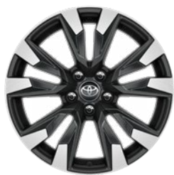
18" kola z lehké slitiny, pneumatiky 235/60 R18 Pro výbavu Comfort