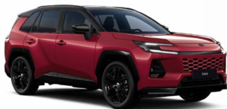
2NF Červená – rubínová se střechou v černé barvě metalický lak, dostupný pro verzi Style 25 000 Kč