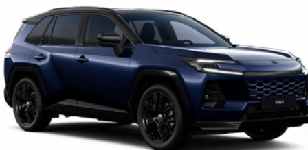
M40 Modrá – tmná se střechou v černé barvě metalický lak, dostupný pro verzi Style 25 000 Kč