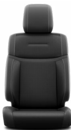
LA20 Kožené čalounění v černé barvě (přírodní a syntetická kůže) Pro výbavu Executive