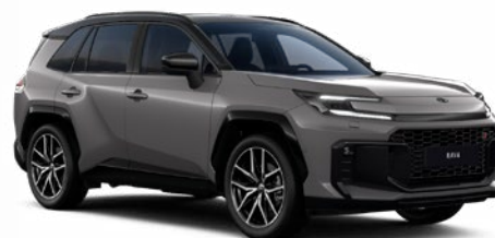
M38 Šedá – kamenná se střechou v černé barvě metalický lak, dostupný pro verze Style a GR SPORT 25 000 Kč