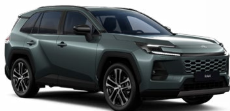
6X7 Zelená – opálová metalický lak, dostupný pro verze Comfort a Executive bez příplatku