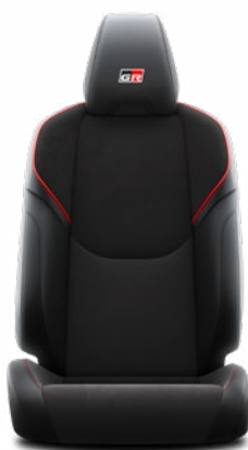
ED20 Semišové a kožené čalounění s červeným prošíváním a logem GR (syntetické materiály) Pro výbavu GR SPORT