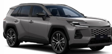
1M6 Šedá – kamenná metalický lak, dostupný pro verze Comfort a Executive 19 000 Kč