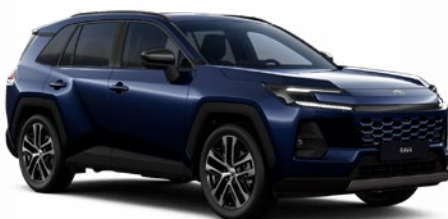
8X8 Modrá – tmná metalický lak, dostupný pro verze Comfort a Executive 19 000 Kč