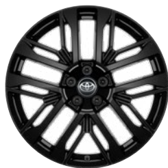
20" kola z lehké slitiny, pneumatiky 235/50 R20 Pro výbavu Style