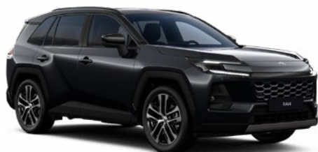
218 Černá – klasická metalický lak, dostupný pro verze Comfort a Executive 19 000 Kč