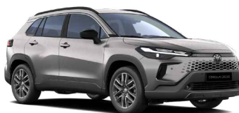
1K0 Stříbrná kovová metalický lak, dostupný pro verze Comfort, Style, Executive 18 000 Kč