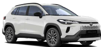
040 Bílá – čistá standardní lak, dostupný pro verze Comfort a Style bez příplatku