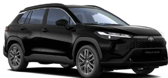
209 Černá – noční obloha metalický lak, dostupný pro verze Comfort, Style, Executive 18 000 Kč