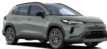
6X3 Zelená Urban standardní lak, dostupný pro verze Comfort, Style a Executive bez příplatku