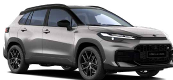
2NK Stříbrná kovová se střechou v černé barvě metalický lak, dostupný pouze pro verzi GR SPORT 24 000 Kč