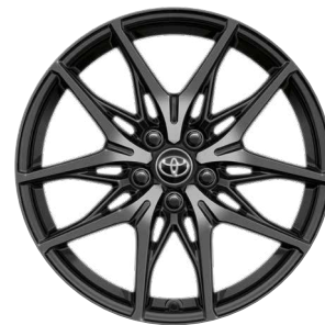
19" kola z lehké slitiny GR SPORT, pneumatiky 225/45 R19 Pro výbavu GR SPORT