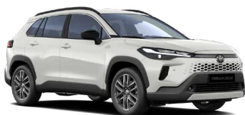
089 Bílá perleťová perleťový lak, dostupný pro verze Comfort, Style a Executive 24 000 Kč