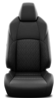
FA20 Textilní černé Pro výbavu Comfort a Style