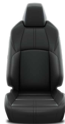
LB20 Kombinace přírodní a syntetické kůže černé Pro výbavu Executive