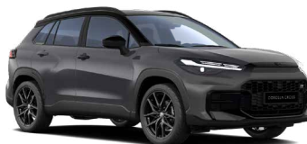
M29 Šedá břidlicová se střechou v černé barvě metalický lak, dostupný pouze pro verzi GR SPORT 24 000 Kč