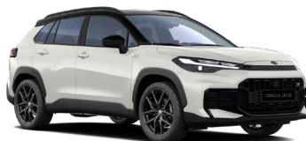
2VP Bílá perleťová se střechou v černé barvě perleťový lak, dostupný pouze pro verzi GR SPORT 24 000 Kč