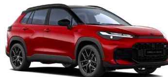
2TB Červená – karmínová se střechou v černé barvě speciální lak, dostupný pouze pro verzi GR SPORT 24 000 Kč