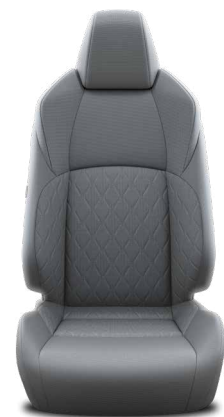
FA10 Textilní šedé Pro výbavu Comfort a Style