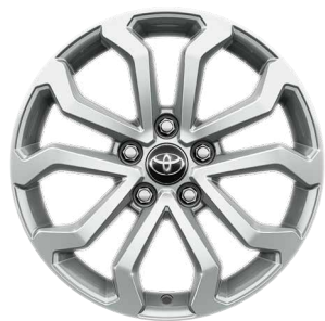
17" kola z lehké slitiny, pneumatiky 215/60 R17 Pro výbavu Comfort