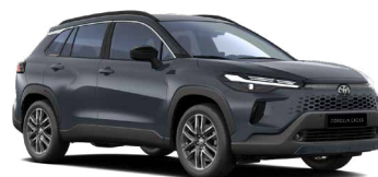
1L6 Modrá ocelová pastelový lak, dostupný pro verze Comfort, Style, Executive 18 000 Kč