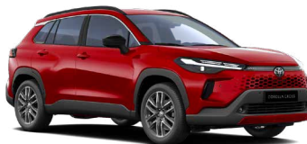
3U5 Červená – karmínová speciální lak, dostupný pro verze Style a Executive 24 000 Kč