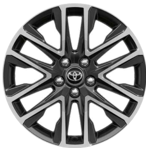
18" kola z lehké slitiny, pneumatiky 225/50 R18 Pro výbavy Style a Executive