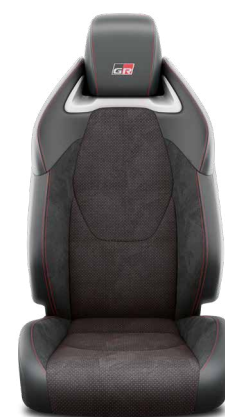
Čalounění z eko-semiše Ultrasuede™ s bočnicemi ze syntetická kůže Pro výbavu GR SPORT