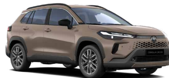
4Z2 Hnědá zemitá metalický lak, dostupný pro verze Comfort, Style, Executive 18 000 Kč