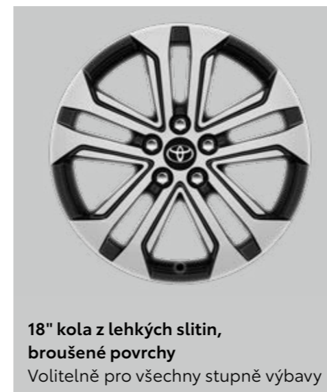
18" kola z lehkých slitin, broušené povrchy Volitelně pro všechny stupně výbavy