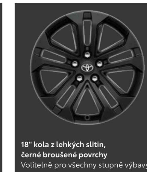
18" kola z lehkých slitin, černé broušené povrchy Volitelně pro všechny stupně výbavy