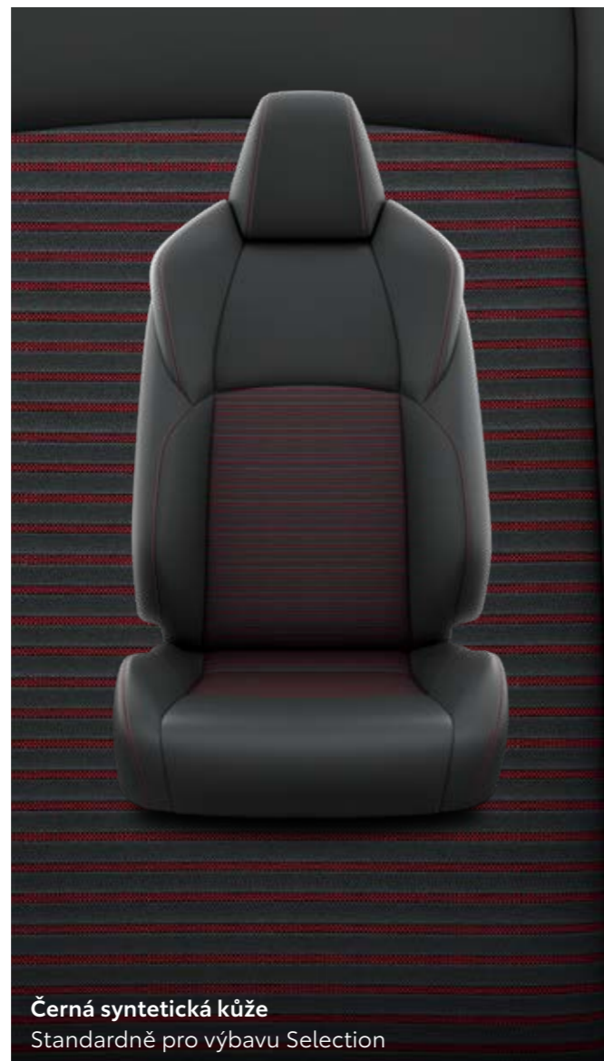
Černá syntetická kůže Standardně pro výbavu Selection