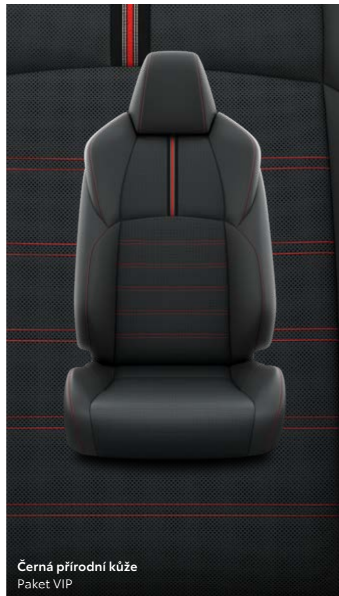
Černá přírodní kůže Paket VIP