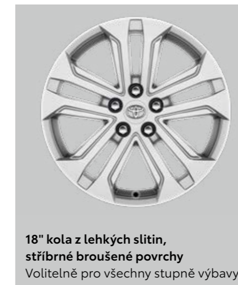
18" kola z lehkých slitin, stříbrné broušené povrchy Volitelně pro všechny stupně výbavy