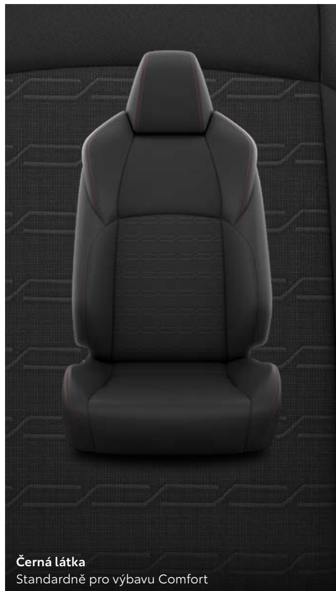
Černá látka Standardně pro výbavu Comfort