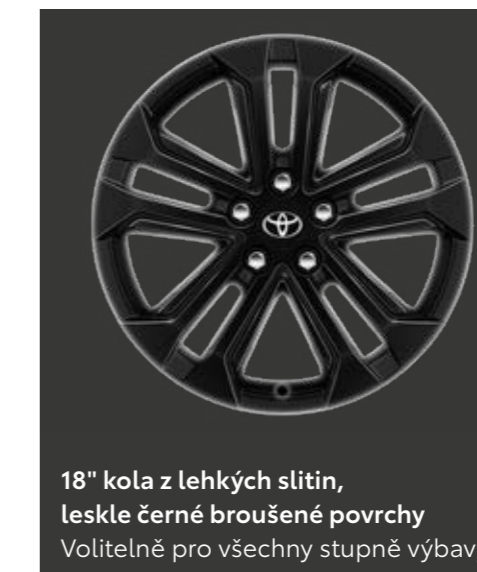
18" kola z lehkých slitin, leskle černé broušené povrchy Volitelně pro všechny stupně výbavy