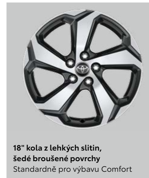
18" kola z lehkých slitin, šedé broušené povrchy Standardně pro výbavu Comfort

Vzhled vozidla završíte atraktivními 18" nebo 19" koly z lehkých slitin s broušenými povrchy. Černé čalounění v kabině nové Toyota RAV4 Plug-in Hybrid může mít podobu syntetické nebo pravé kůže s kontrastním červeným prošíváním, které dodá interiéru sportovnější náboj.