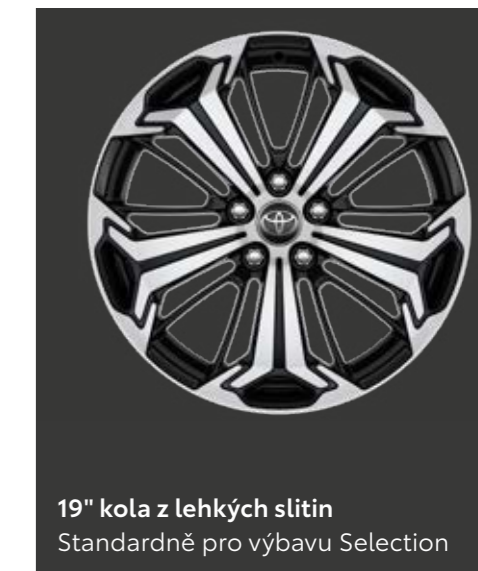
19" kola z lehkých slitin Standardně pro výbavu Selection