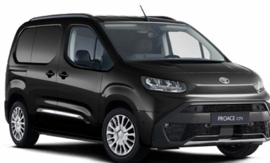
KTV – Černá Vesmírná metalický lak 12 400 Kč