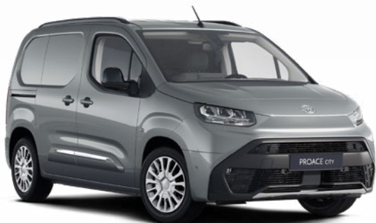
KCA Stříbrná atomická metalický lak 12 400 Kč