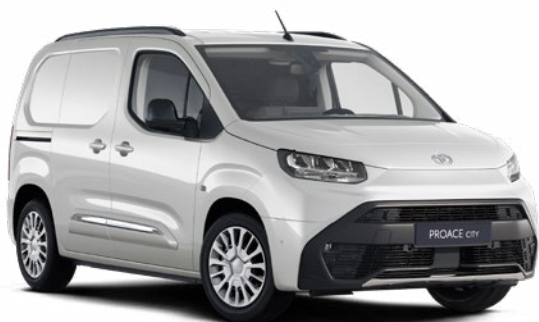
EPR Bílá – ledová standardní lak bez příplatku