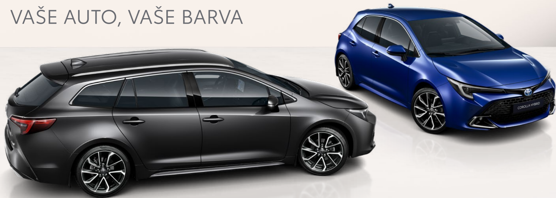
Nabídka odstínů karoserie pro model Toyota Corolla Hatchback a Touring Sports