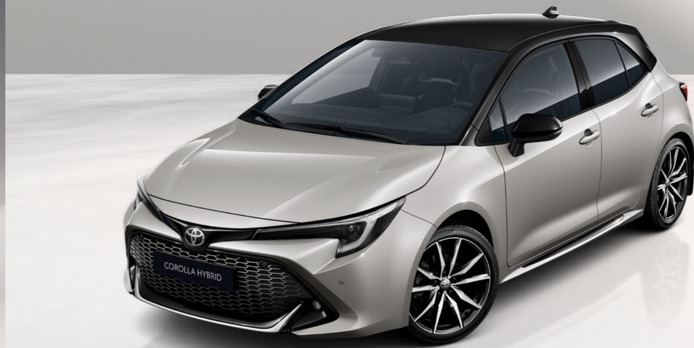
Varianty dvoubarevného lakování pro model Toyota Corolla Hatchback a Touring Sports*