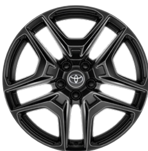
19" kola z lehké slitiny, pneumatiky 235/55 R19 Pro výbavu GR SPORT