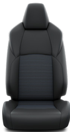
EC20 Syntetická kůže / textilie v designu Selection Pro výbavu Selection