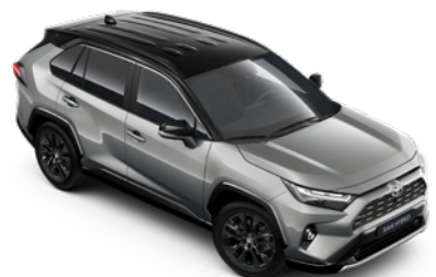
2QY Stříbrná – zirkonová se střechou v černé barvě metalický lak, dostupný pouze pro verze Selection a GR SPORT 25 000 Kč