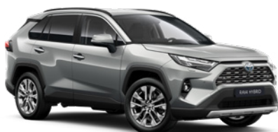
1D6 Stříbrná – zirkonová metalický lak, dostupný pro verze Comfort a Executive 19 000 Kč