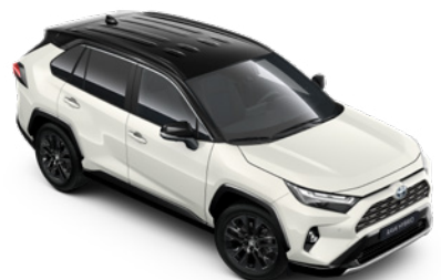
2PS Bílá – perleťová se střechou v černé barvě perleťový lak, dostupný pouze pro verze Selection a GR SPORT 25 000 Kč