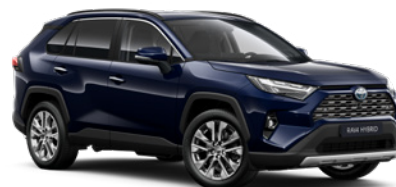
8X8 Modrá – tmná metalický lak, dostupný pro verze Comfort a Executive 19 000 Kč