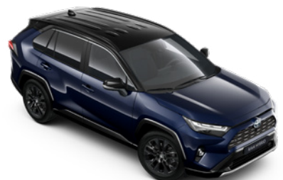
2RA Modrá – tmná se střechou v černé barvě metalický lak, dostupný pouze pro verze Selection a GR SPORT 25 000 Kč