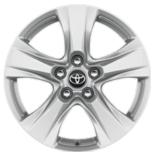
17" kola z lehké slitiny, pneumatiky 225/65 R17 Pro výbavu Comfort