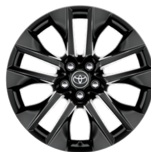
19" kola z lehké slitiny v černém designu, pneumatiky 235/55 R19 Pro výbavu Selection