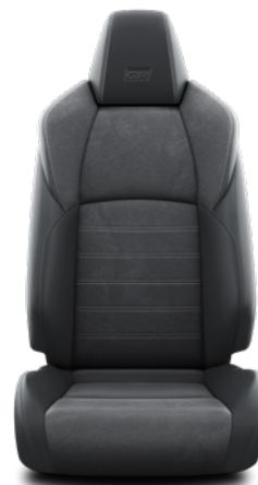
EF20 Černá Alcantara v designu GR SPORT Pro výbavu GR SPORT