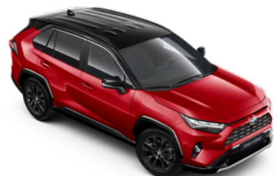
2SC Červená – karmínová se střechou v černé barvě speciální lak, dostupný pouze pro verze Selection a GR SPORT 25 000 Kč