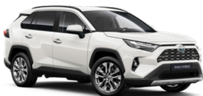
040 Bílá – čistá standardní lak, dostupný pro verze Comfort a Executive bez příplatku