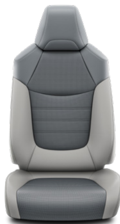
LA10 Kombinace přírodní a syntetická kůže šedé Pro výbavu Executive