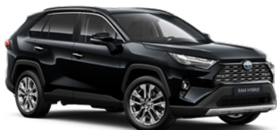
218 Černá – klasická metalický lak, dostupný pro verze Comfort a Executive 19 000 Kč