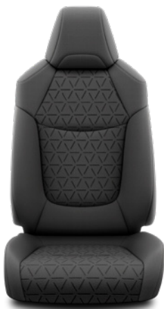
FA20 Textilní černé Pro výbavu Comfort