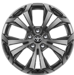
18" kola z lehké slitiny, pneumatiky 225/60 R18 Pro paket Style