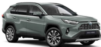
6X3 Zelená – Urban standardní lak, dostupný pro verze Comfort a Executive 19 000 Kč