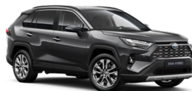
1G3 Šedá – popelavá metalický lak, dostupný pro verze Comfort a Executive 19 000 Kč