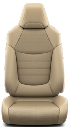
LA40 Kombinace přírodní a syntetická kůže béžové Pro výbavu Executive