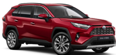
3T3 Červená – rubínová speciální lak, dostupný pro verze Comfort a Executive 25 000 Kč