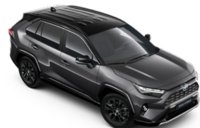
2QZ Šedá – popelavá se střechou v černé barvě metalický lak, dostupný pouze pro verze Selection a GR SPORT 25 000 Kč