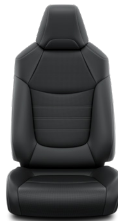
LA20 Kombinace přírodní a syntetická kůže černé Pro výbavu Executive