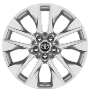
19" kola z lehké slitiny, pneumatiky 235/55 R19 Pro výbavu Executive