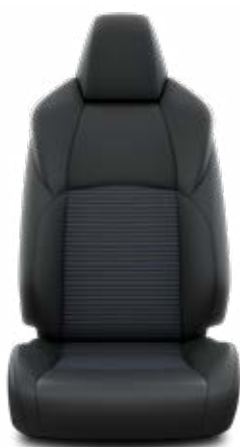
EC20 Syntetická kůže/textilie v designu Selection Pro výbavu Selection