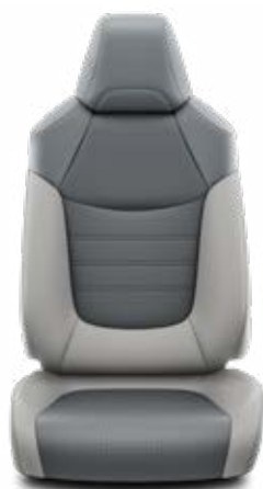
LA10 Kombinace přírodní a syntetická kůže šedé Pro výbavu Executive