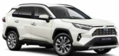
089 Bílá – perleťová perleťový lak, dostupný pro verze Comfort a Executive 22 500 Kč