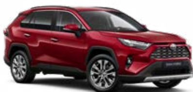
3T3 Červená – rubínová speciální lak, dostupný pro verze Comfort a Executive 22 500 Kč, pro výbavu Adventure bez příplatku