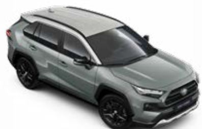
2QU Zelená – Urban se střechou v barvě stříbrná popelavá standardní lak, dostupný pouze pro verzi Adventure bez příplatku