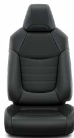
LA20 Kombinace přírodní a syntetická kůže černé Pro výbavu Executive