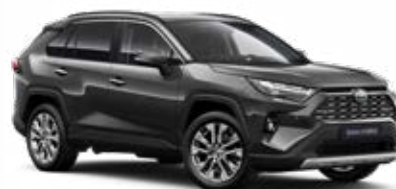
1G3 Šedá – popelavá metalický lak, dostupný pro verze Comfort a Executive 15 000 Kč, pro výbavu Adventure bez příplatku