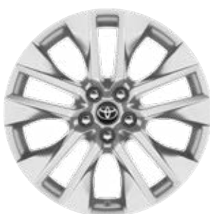
19" kola z lehkých slitin, pneumatiky 235/55 R19 Pro výbavu Executive