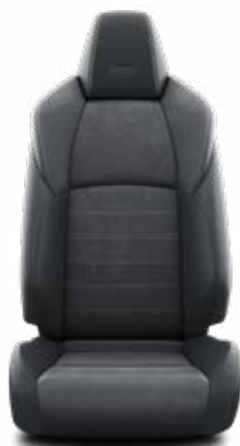
EF20 Černá Alcantara v designu GR SPORT Pro výbavu GR SPORT