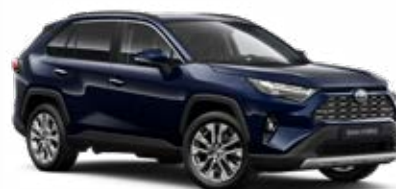
8X8 Modrá – tmná metalický lak, dostupný pro verze Comfort a Executive 15 000 Kč