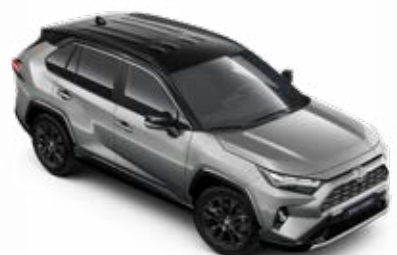
2QY Stříbrná – zirkonová se střechou v černé barvě metalický lak, dostupný pouze pro verze Selection a GR SPORT bez příplatku