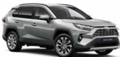
1D6 Stříbrná – zirkonová metalický lak, dostupný pro verze Comfort a Executive 15 000 Kč