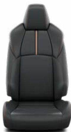
EB20 Syntetická kůže v designu Adventure Pro výbavu Adventure