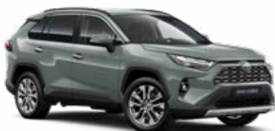
6X3 Zelená – Urban standardní lak, dostupný pro verze Comfort a Executive 15 000 Kč, pro výbavu Adventure bez příplatku