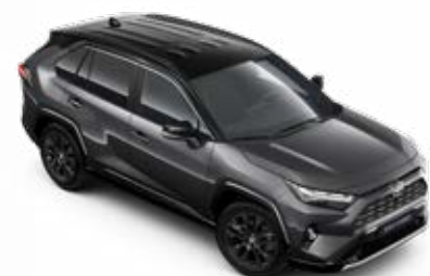
2QZ Šedá – popelavá se střechou v černé barvě metalický lak, dostupný pouze pro verze Selection a GR SPORT bez příplatku