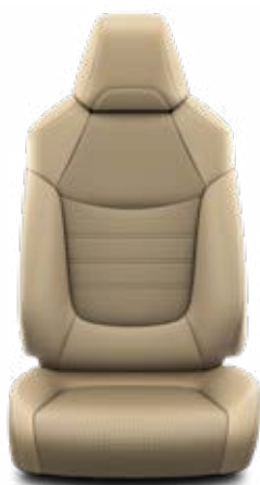
LA40 Kombinace přírodní a syntetická kůže béžové Pro výbavu Executive