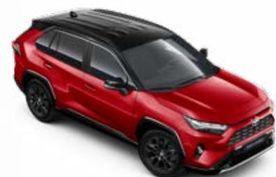
2SC Červená – karmínová se střechou v černé barvě speciální lak, dostupný pouze pro verzi GR SPORT bez příplatku

Pro výbavu Adventure není možné jednobarevné lakování kombinovat s pakem Skyview.