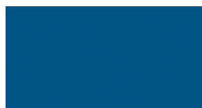
8T7 Modrá - ostrovní*